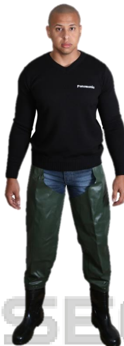
SOBRE CALÇA VERDE EMBORRACHADA